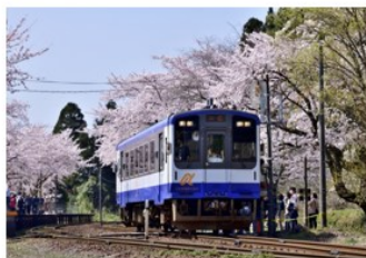
穴水町 | 能登さくら駅