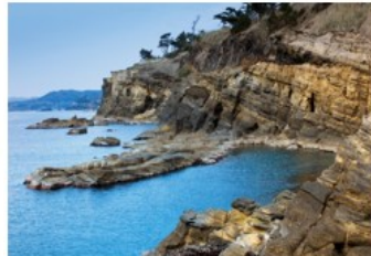
志賀町 | ヤセの断崖