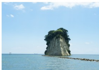
珠洲市 | 見附島