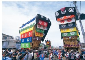
七尾市 | 青柏祭