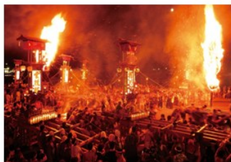
能登町 | あぶれ祭り