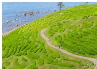
輪島市 | 白米千畝田