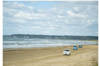
羽咋市 | 千里浜なぎさドライブウェイ