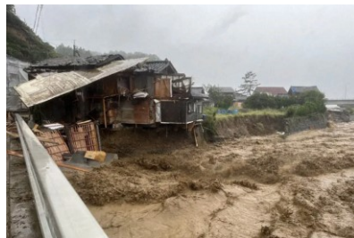
普段は静かな流れの南志見川は姿を変えた 2024年9月23日毎日新聞より