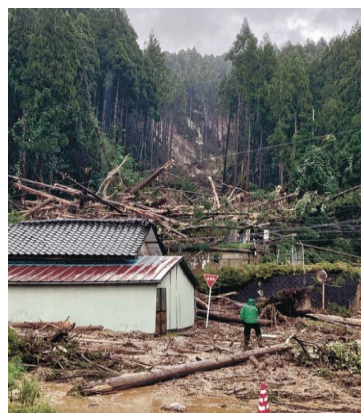
民家になだれ込む土砂 2024年9月22日

ゆめ風基金では豪雨の直後から情報を集め、6月に事務局メンバーが訪問した輪島市の「もんぜん楓の家」や、能登町の「やなぎだハウス」などがひどい被害に遭ったと聞きました。輪島市の「一互一笑」の障害のあるお子さんがいる職員も豪雨被害に遭い、自宅に住めない状況です。同じく輪島市の「あすなろふたばぱいんの会」では、職員も被災するとともに、利用者が住んでいるところが豪雨で孤立集落となり、一時連絡が取れなくなったなど、心配な情報が次々に舞い込んできました。