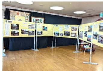
「のとからの風」展の様子

1人でも多くの人にこの冊子を手にしていただき、能登の人たちを襲った災害の大きさと、そこから立ち上がる人たちの歩みやその人たちの思いを、しかと心に刻んでいただけたら、と思います。～「はじめに」より抜粋～