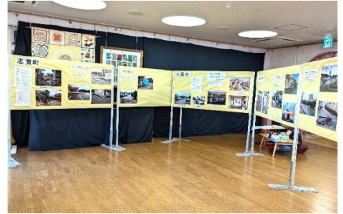
「のとからの風」展の様子

1人でも多くの人にこの冊子を手にしていただき、能登の人たちを襲った災害の大きさと、そこから立ち上がる人たちの歩みやその人たちの思いを、しかと心に刻んでいただけたら、と思います。～「はじめに」より抜粋～