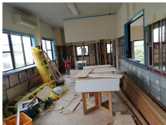
放課後等デイサービスガラパゴス