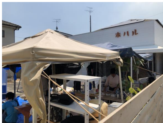
岡山県真備町 ホタル