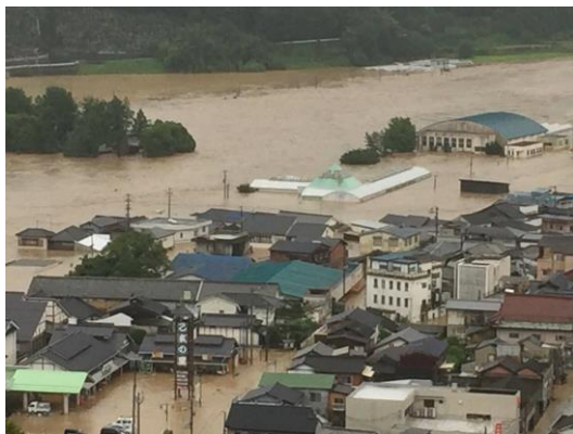
愛媛 レインボーアグリのあった場所

ただ今なお再建計画が立たず、計画が決まってから申請をするという事業所も3件ほど聞いています。