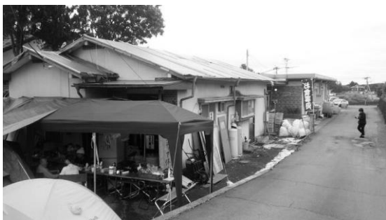
たんぽぽ作業所（西原村）