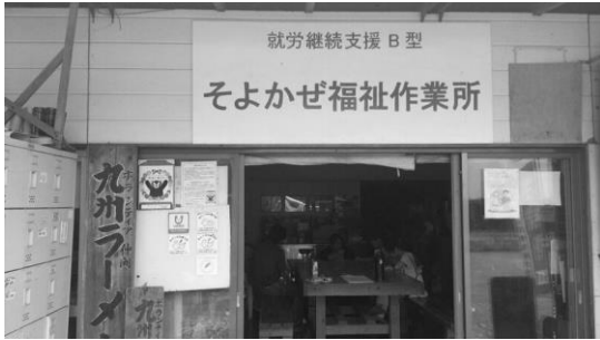
そよかぜ作業所 (益城町)