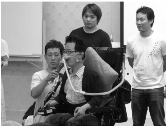
関西に避難したFさん。8. 6集会にて