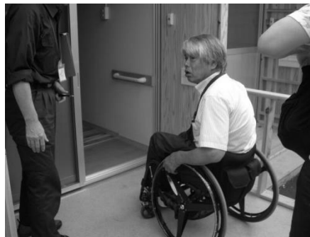
仮設住宅を点検する東事務局長