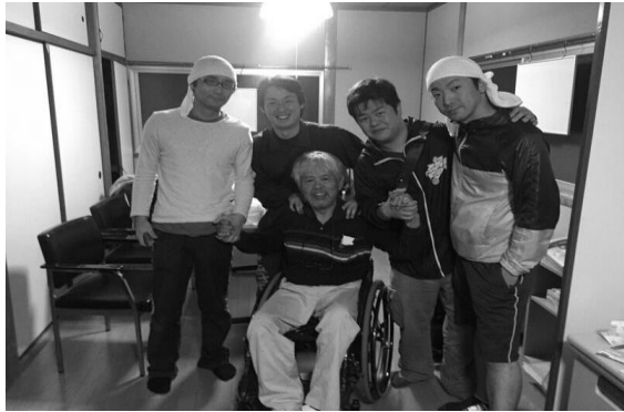
旧被災地障害者センター内部 中央がセンター東事務局長