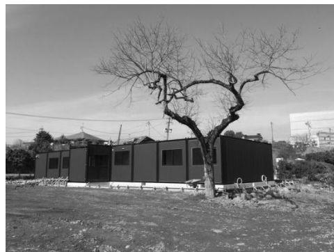
2017年2月にオープンした益城町地域創生館