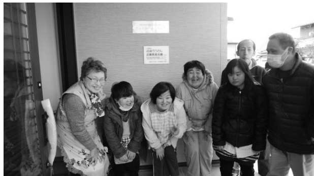
なこそ グループホーム入り口で