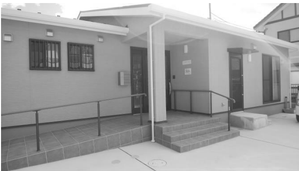
なこそ授産所グループホーム