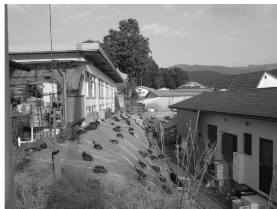
たんぽぽ作業所斜面