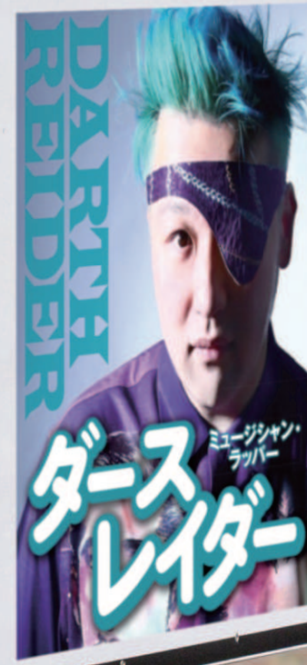
ミュージシャン ラッパー ダース レイダー